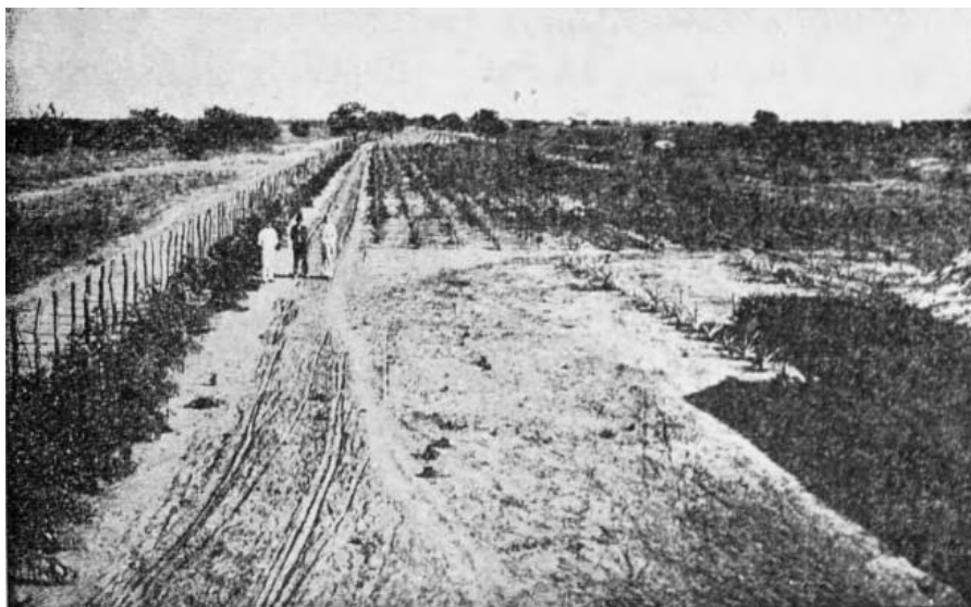
Figura 6: Plantação de Eucalipto no Horto de Juazeiro.