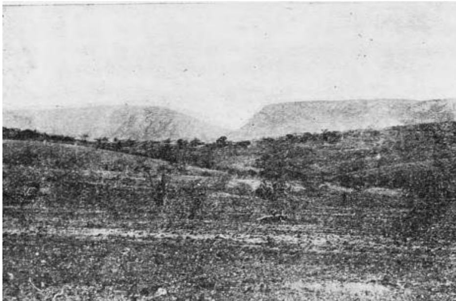
Figura 1. Área de caatinga devastada